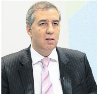
O vice-governador e titular da SSPAP, José Elton, quer liderar comitiva nacional de secretários de Segurança Pública, com presença dos membros do Pacto Integrado formado por 10 estados, em audiências na Câmara dos Deputados; dirigentes serão recebidos pelo presidente Rodrigo Maia

Elton cita o envelhecimento das leis penais e a Lei de Execução Penal, a progressão de regime de cumprimento de pena, e pediu também a revisão de audiências de custódia e de questões relativas a penalidades alternativas que acabam por incentivar a prática criminosa.