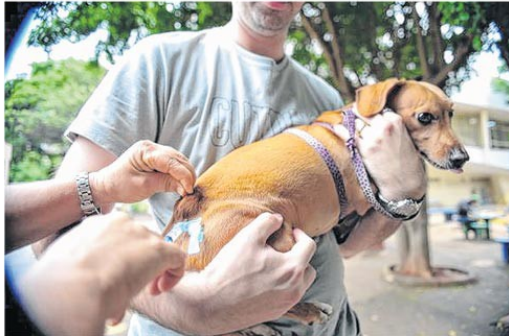
A ação terá a participação de dois mil profissionais e contará com 390 postos fixos, além de alguns volantes em locais de difícil acesso, que funcionarão das 8h às 17h