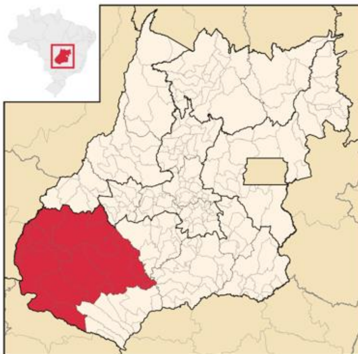
Região Sudoeste de Goiás