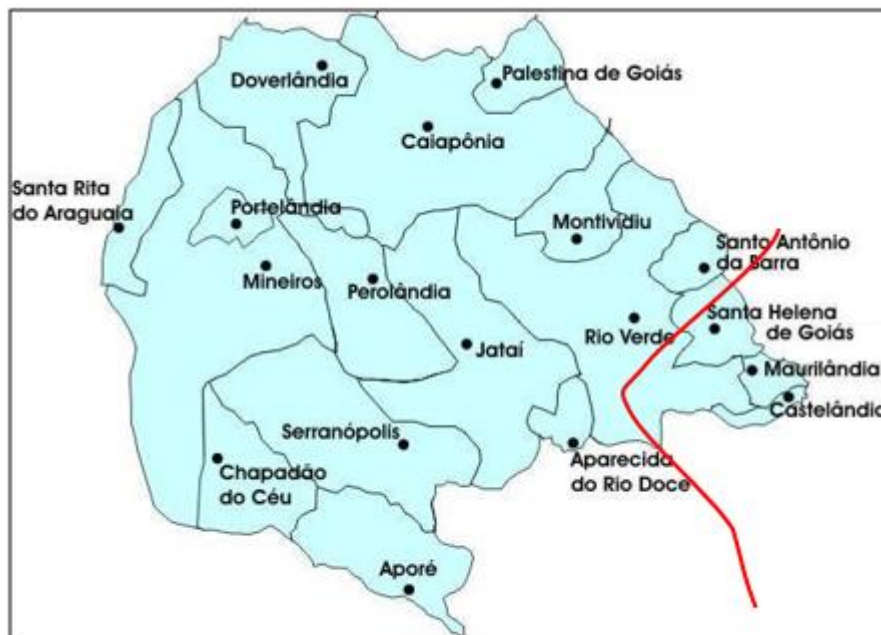
Municípios da Região Sudoeste de Goiás e Ferrovia Norte-Sul

A concepção inicial do Polo de Cargas de Santa Helena, elaborada em novembro de 2011 era incompatível com o atual padrão de operações da Ferrovia Norte-Sul em especial quanto à movimentação das composições nas vias dos polos de carga.